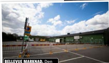
BELLEVUE MARKNAD. Den populära marknaden har varit stängd sedan våren 2020. Vanligtvis fylls platsen med försäljare och fyndjägare på helgerna.

073-620 14 59 lovisa.hansson@goteborgdirekt.se