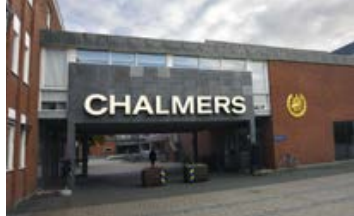
SÄKRAST. Chalmers har korats som den mest coronasäkra arbetsplatsen.

Chalmers coronasäkraste arbetsplatsen CENTRUM. Chalmers tekniska högskola är den mest coronasäkra arbetsplatsen i Sverige och dessutom bästa arbetsplatsen på att erbjuda distansarbete.